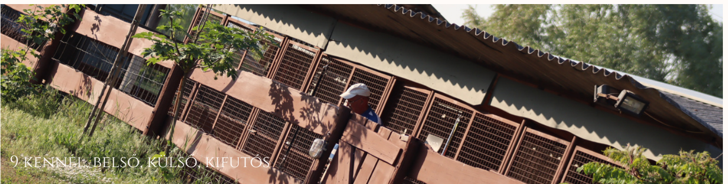
9 KENNEL, BELSŐ, KÜLSŐ, KIFUTÓS