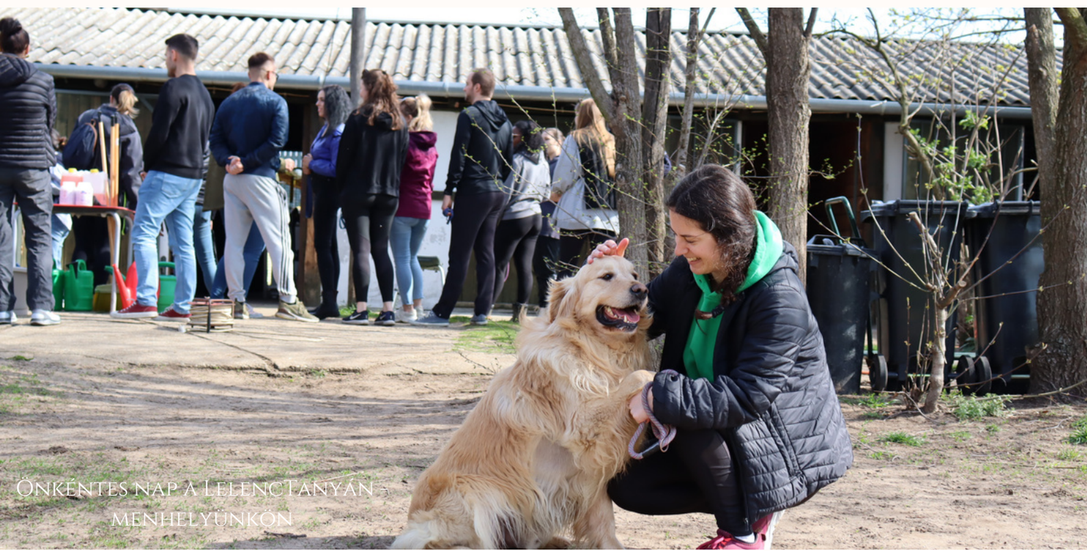
ÖNKÉNTES NAP A LELENCTANYÁN MENHELYÜNKÖN