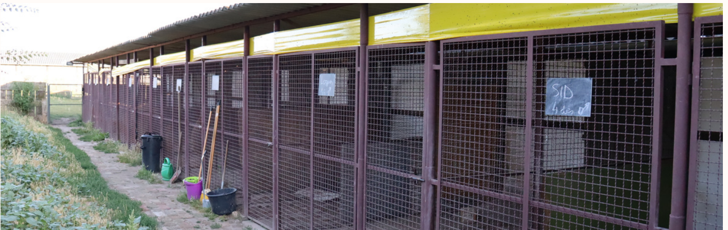
9 KENNEL, BELSŐ, KÜLSŐ, KIFUTÓS

2004 decemberében alapítottam Lelenc Kutya Mentő Egyesületet, majd 7 évnyi működés után építettük fel a Lelenc Tanya nevű menhelyet, amely Vácrátót külterületén, az erdő közepén helyezkedik el egy 11 hektáros területen és alapvetően kutyák mentésével foglalkozik, de hogy-hogy nem, mindig sok cica is él nálunk. :)