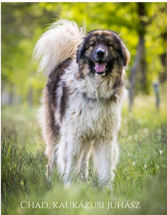
CHAD, KAUKÁZUSI JUHÁSZ

Az örökbeadási protokollunk szigorú, a gazdijelölteket minden esetben komolyan szűrjük, hogy valóban a megfelelő kutyát vihessék haza és valóban családtagként élhessen a kutya. Szintén része az örökbeadásnak az utánkövetés.