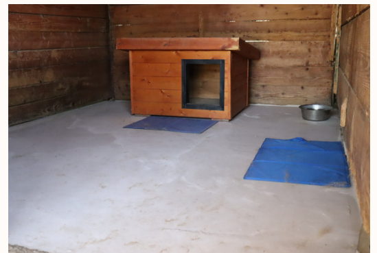
SZIGETELT HÁZ, JÓL TISZTÍTHATÓ BETONALAP, FEDETT, MINDEN OLDALRÓL ZÁRT KENNEL

A felelős állattartás példáját mutatjuk, a polgároktól azt várjuk el, hogy legalább olyan körülmények között tartsák kutyáikat, ahogyan mi. Megmutatjuk, hogy foglalkozással, neveléssel, tiszta, rendezett körülmények között élő kutyák mennyi örömet szereznek.