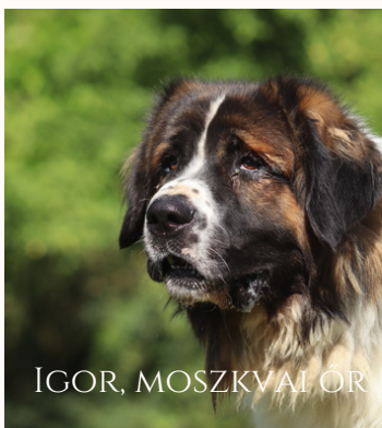
IGOR, MOSZKVAI ÖRÖK